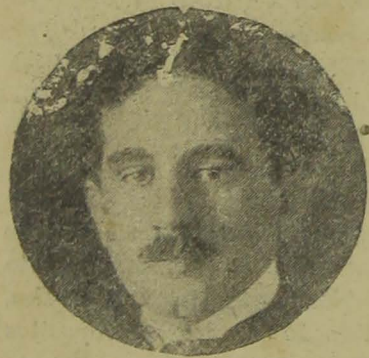
Dr. Alvaro de Carvalho

Figura de relevo intellectual e politico em nossa terra, o natus